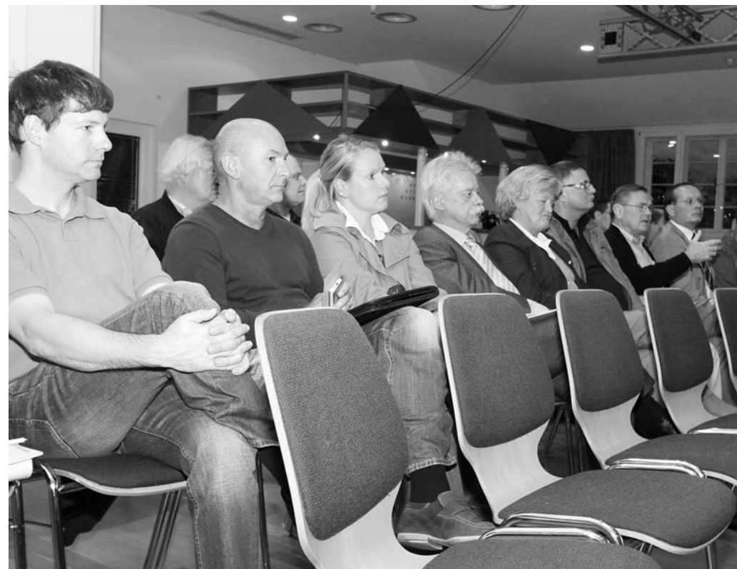
Besorgte Mienen: Die wenigen Teilnehmer hören genau zu.